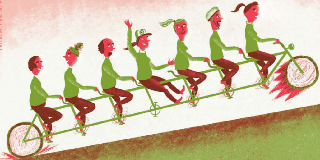
Illustration: Franziska Walther