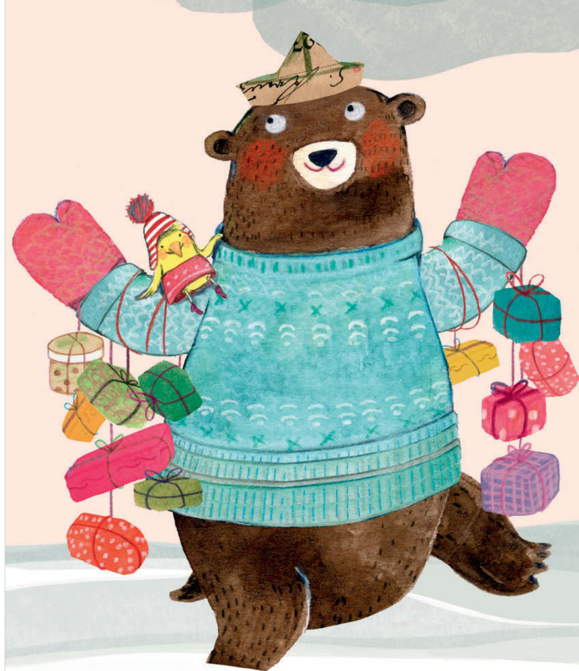
Abbildung rechts: „Bär im Schnee“

Und auch außerhalb dieses Rahmens suchen wir den Kontakt: Sei es durch gezielte Gespräche mit Verwertern, gemeinsamen Gesprächsrunden oder Podiumsdiskussionen. Verwerter und Illustrator*innen haben oft gemeinsame Interessen – durch eine gute Kommunikation und aktive Zusammenarbeit lassen sich diese besser präsentieren und durchsetzen.