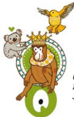
Urheberin der IO-Illustration: Judith Drews

Diese Frage bekommen wir in der IO häufig gestellt. Darauf gibt es viele Antworten, aber Tatsache ist: Talent allein reicht dafür nicht aus.